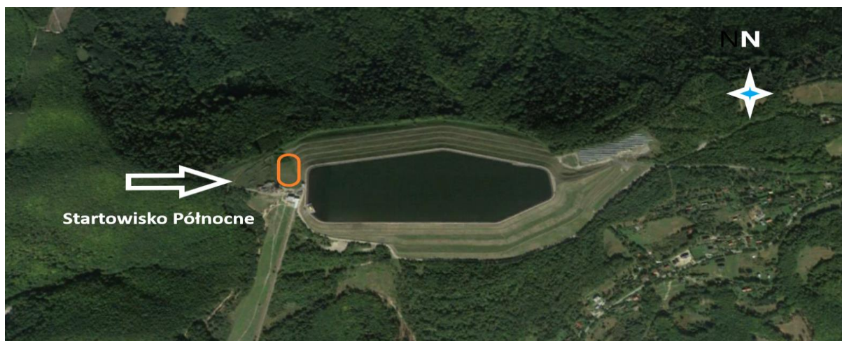
Rys. 1. Góra Żar, miejsce startu paralotni w tandemie.